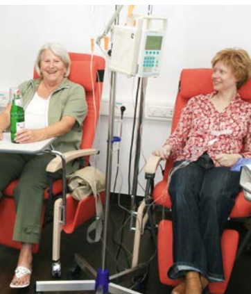
Raum der Ruhe und Kraft